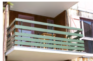
Palines horizontales laquage cérusé vert texturé.