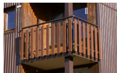
Palines laquées ton bois.