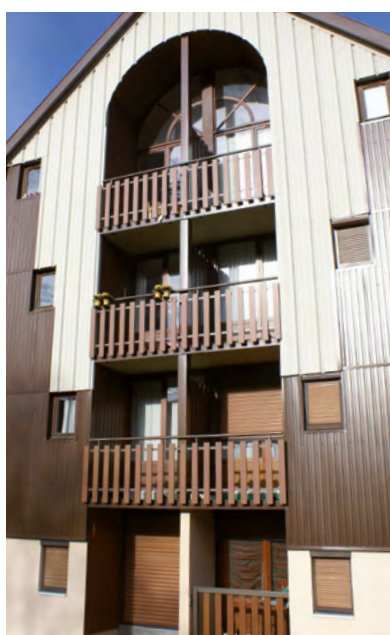
Palines laquées ton bois.