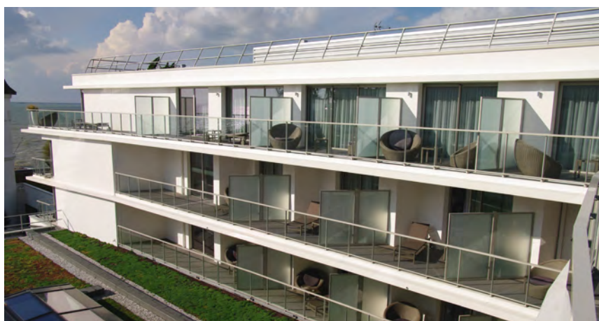
Séparations avec vitrage granité.