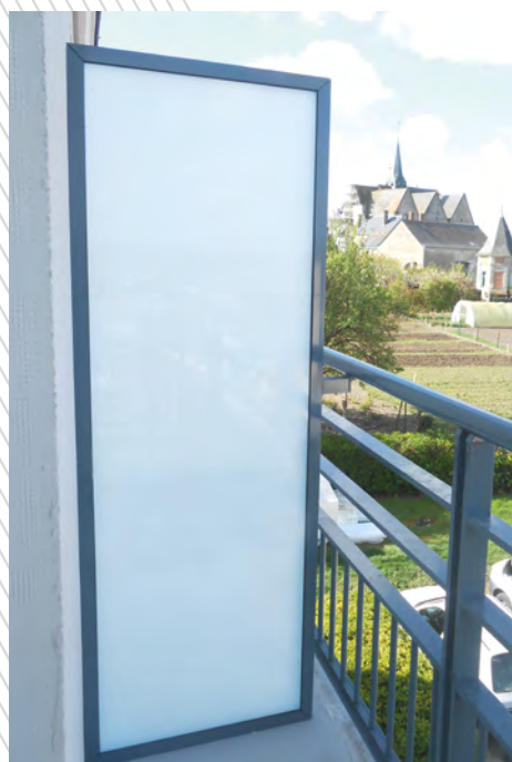
Séparation rectangulaire avec vitrage opale.