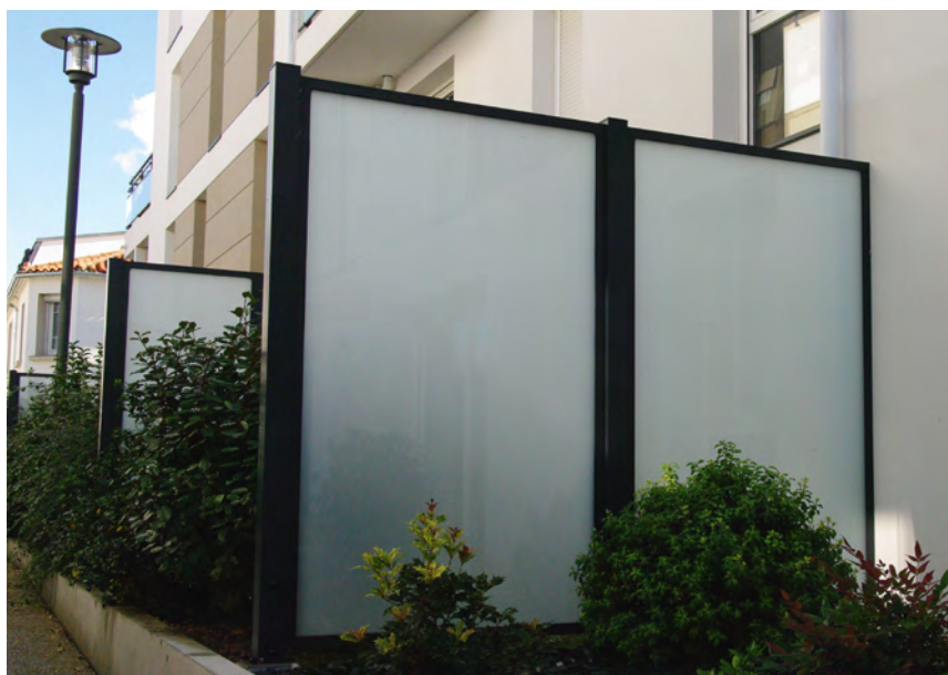
Séparation double avec poteaux de fixation et vitrage opale.