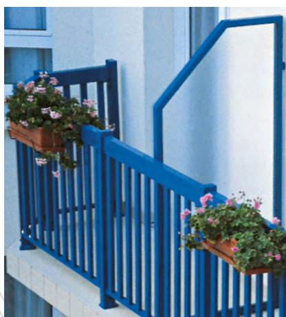
Option pan coupé.