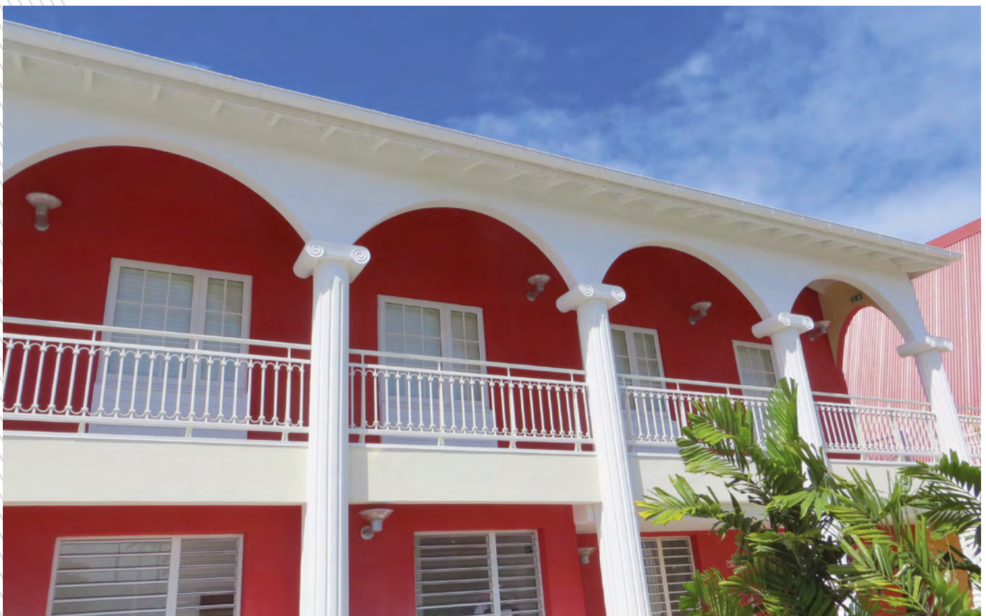
ARTIK vide sous main courante avec option décor demi lune.