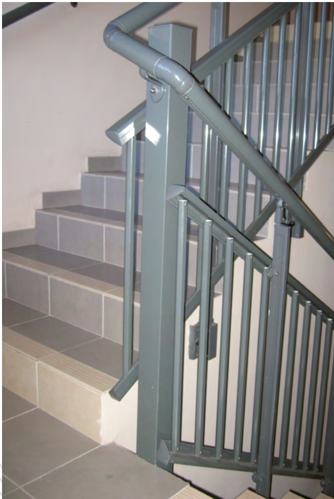
Détail poteau limitant le vide et assurant la continuité de la main courante.