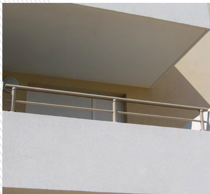
ARIANE à double lisses.